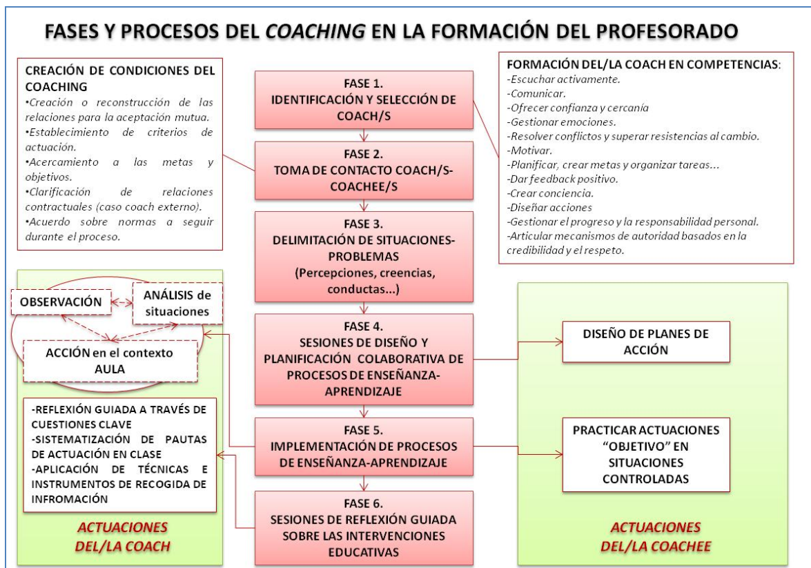
FIGURA 2. Fases formativas y procesos metodológicos del Coaching

La revisión analítica de los estudios contribuye a organizar y sistematizar las fases y procesos metodológicos del Coaching para el desarrollo profesional docente (Figura 2):